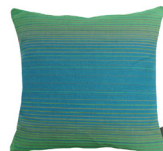
6407T 48 x 48 cm