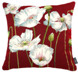
6400A 48 x 48 cm