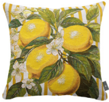
6411J 48 x 48 cm