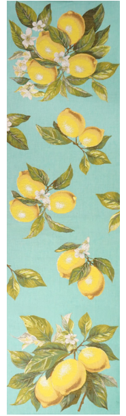
6416V 50 x 180 cm