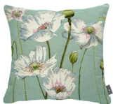
6400V 48 x 48 cm