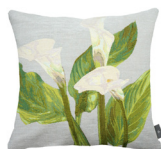
6332G 48 x 48 cm