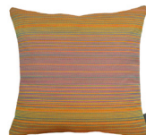
6408O 48 x 48 cm