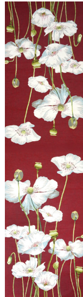
6406A 50 x 180 cm