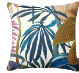
6390B 48 x 48 cm