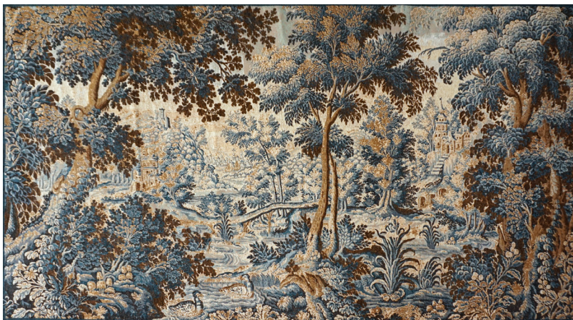
9309X 150 x 250 cm