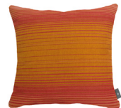
6407O 48 x 48 cm