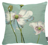
6401V 48 x 48 cm