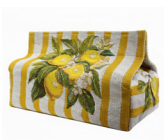
BM6415J 24 x 12 cm