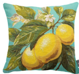
6412V 48 x 48 cm