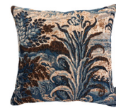
9313X 48 x 48 cm