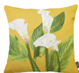
6332J 48 x 48 cm