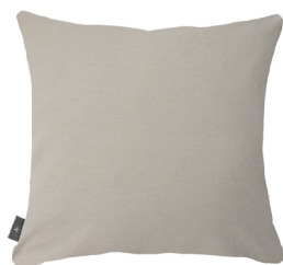
Dos coton uni Plain cotton back