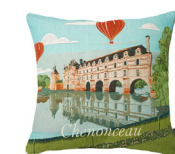
6393T 48 x 48 cm