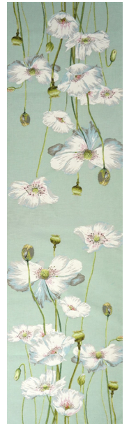
6406V 50 x 180 cm