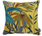
6391J 48 x 48 cm