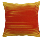
6407A 48 x 48 cm