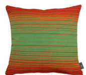
6407V 48 x 48 cm