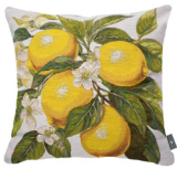
6411B 48 x 48 cm