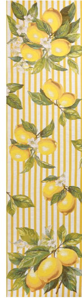
6416J 50 x 180 cm