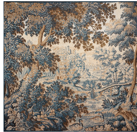
9308X 150 x 150 cm