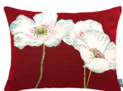
6402A 38 x 48 cm