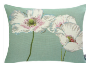
6402V 38 x 48 cm