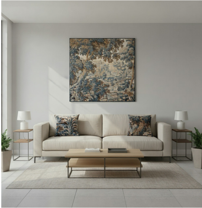
TISSÉ EN LAINE & COTON WOVEN IN WOOL & COTTON