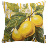
6412J 48 x 48 cm