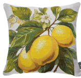
6412B 48 x 48 cm