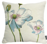
6401B 48 x 48 cm