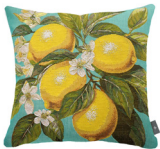
6411V 48 x 48 cm