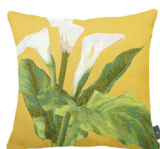
6333J 48 x 48 cm