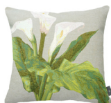
6333G 48 x 48 cm