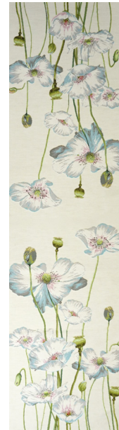
6406B 50 x 180 cm