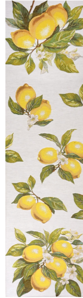
6416B 50 x 180 cm