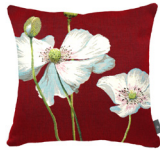
6401A 48 x 48 cm