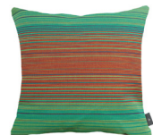
6408V 48 x 48 cm