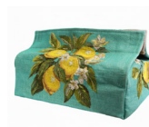
BM6415V 24 x 12 cm