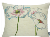
6402B 38 x 48 cm