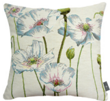
6400B 48 x 48 cm