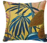
6390J 48 x 48 cm