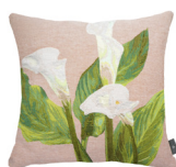
6332E 48 x 48 cm