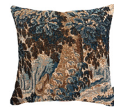
9314X 48 x 48 cm