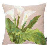
6333E 48 x 48 cm