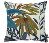
6391B 48 x 48 cm